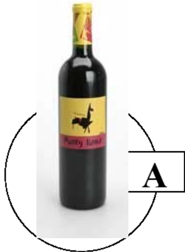
Funky Llama Malbec kr. 799