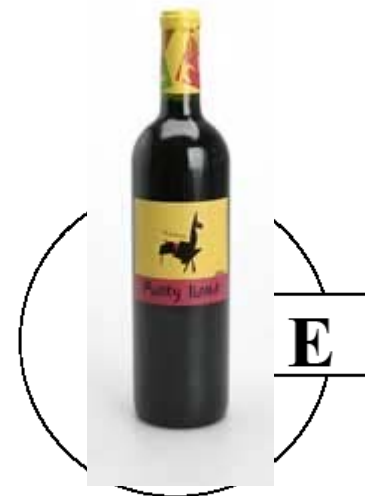
Funky Llama Malbec kr. 799