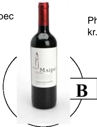
Maipo Cabernet Sauvignon Reserva kr. 1.340