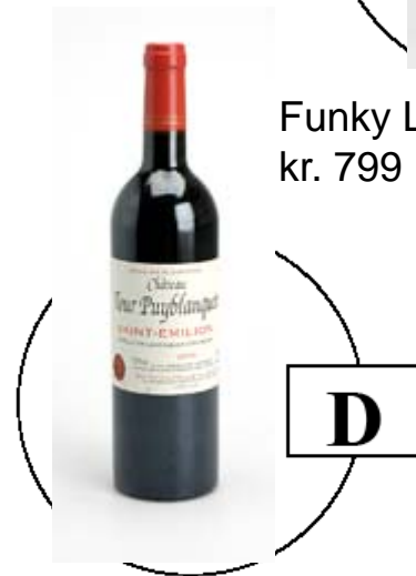
Chateau Tour Puyblanquet kr. 1.890